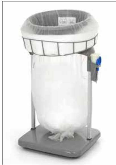
Classic Maxi/Maxi Food