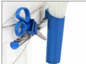
Kabelbinderhalter für Dynamic (nur Halter)

Der Kabelbinderhalter ist sowohl für Maxi als auch für Mini geeignet.