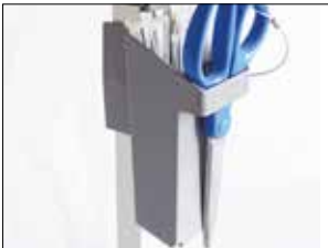
Kabelbinderhalter für Classic

Item no. 33890 Die Umrandung fixiert den Müllbeutel in seiner Position.