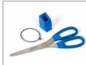
Schersensatz für Dynamic, metalldetektierbar

Kabelbinderhalter alle Dynamic Versionen.