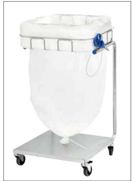
Dynamic Maxi/Maxi Pedal