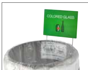
Schildhalter für Classic & Dynamic

Für Artikel-Nr. Siehe Diagramme. Schilder sind in A4Portrait oder A5Landscape erhältlich.