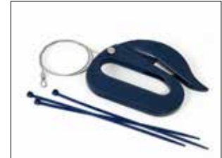
Sicherheitsmesser - Schneider Kit

Item no. 34609 Satz mit metalldetektierbarer Schere, Scherenhalter und Edelstahlraht.