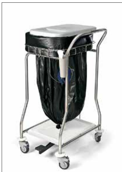
Dynamic Midi Nouvo Pedal