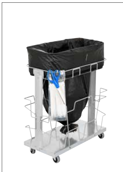
Dynamic Midi UBS