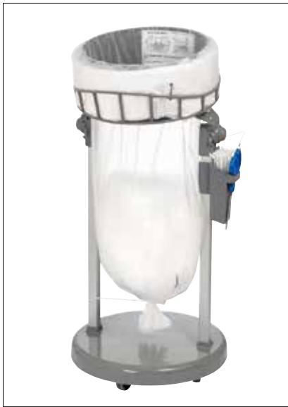
Classic Mini/Mini Food