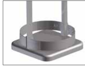
Umrandung für Classic Maxi

Item no. 30170 Reduziert die Öffnungsgröße und ermöglicht eine leichtere Kompression von beispielsweise recyceltem Kunststoff.