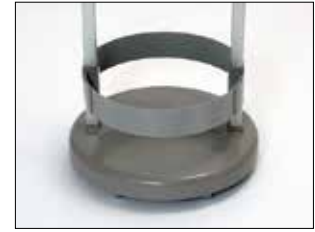
Umrandung für Classic Mini

Item no. 33900 Die Umrandung fixiert den Müllbeutel in seiner Position.