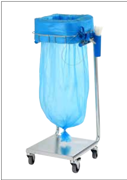
Dynamic Mini/Mini Pedal