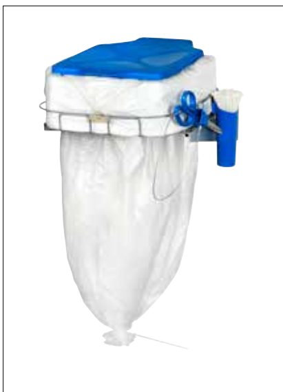
Dynamic Mini with lid

Die Dynamic Mini mit Deckel und die Midi-Versionen sind Wandlösungen. Diese sind ideal für Bereiche mit begrenztem Platzangebot und für Anwendungen, bei denen Hygiene besonders wichtig ist. Außerdem erleichtern sie die Reinigung.