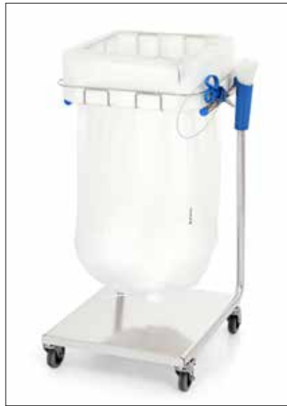
Dynamic Midi/Midi Pedal