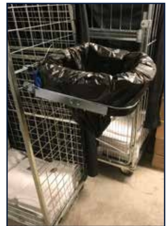
MIDI / MIDI GRITTER (Art. nr. 34350 / 34355)

Höhe ..... 159 mm Breite ..... 374 mm Tiefe ..... 264 mm Öffnung ..... 284x164 mm