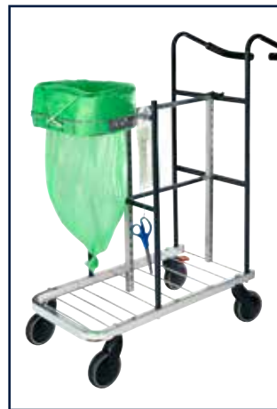
MINI (Art. nr. 34300)

Höhe ..... 159 mm Breite ..... 374 mm Tiefe ..... 264 mm Öffnung ..... 284x164 mm